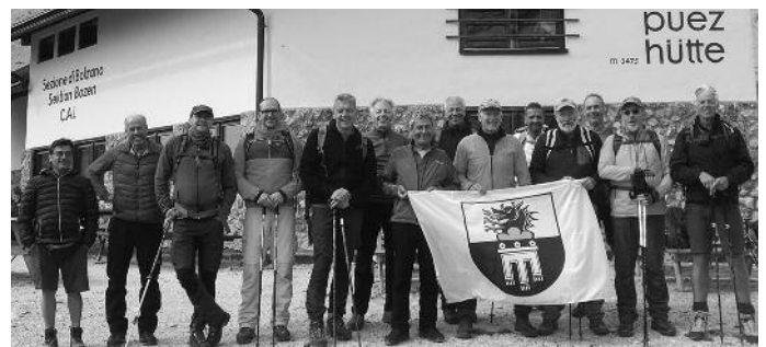
An den Abenden nutzten die Steinhilber Jedermänner den Wellnessbereich des Hotels und ließen sich von der Südtiroler Küche verwöhnen. Bei

Über Nacht hatte sich das Wetter verschlechtert und so starteten die Steinhilber Jedermänner am Samstagmorgen bei wolkenverhangenem Himmel, aber angenehmen Temperaturen zu ihrer gemeinsamen Tour durch das Langental zur Puez-Hütte im Naturpark Puez-Geisler. Diese wurde nach über 3-stündigem Aufstieg über 900 Höhenmeter auf 2.475m erreicht. Inzwischen ließ sich ab und zu die Sonne wieder blicken und gestattet immerhin eine eingeschränkte Aussicht zum Sellamassiv und zum Langkofel hinüber. Über den Rundweg durch steile, großteils grüne von senkrechten Felsen überragte Hänge mit kleinen Wasserfällen, stiegen die Bergkameraden wieder hinunter in den Talschluss des Langentales, wo sie bei der Almhütte La Ciajota unterhalb der Ruine Wolkenstein noch eine kleine Rast einlegten.