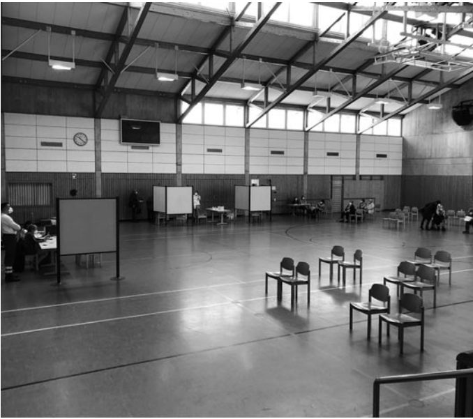
Die Werdenberg-Halle war zum ersten Einsatz als Impfzentrum luftig doch durchaus fachgerecht möbliert worden.