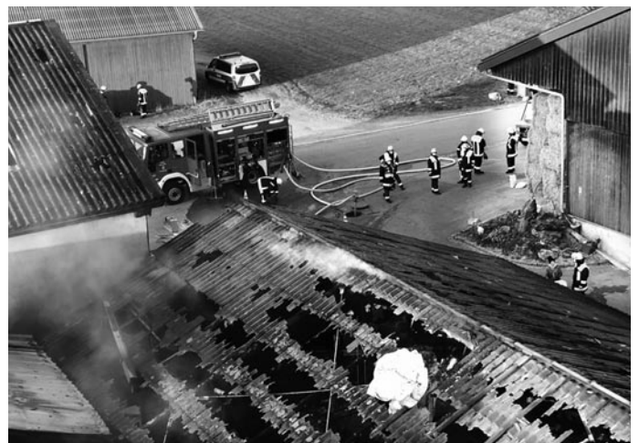
Dem beherzten Einsatz der Feuerwehren ist es zu verdanken, dass in den benachbarten Ställen und Scheunen dicht neben dem Brandherd ein beträchtlicher Sachschaden verhindert werden konnte.

Einigen Unmut erregte Freitag- und Samstagnachmittag eine kleine Gruppe von Tierschützern, die es für angebracht hielt, vor Ort gegen die Massentierhaltung zu protestieren. Zur Reaktion zog am Samstag eine 200 Personen umfassende Solidargruppe der Kreisbauernschaft auf, die nicht nur den Tierschützern erfolgreich demonstrieren konnte, dass ein Zuchtbetrieb als Partner seines Viehbestandes im Leben steht, und nicht als sein Ausbeuter.